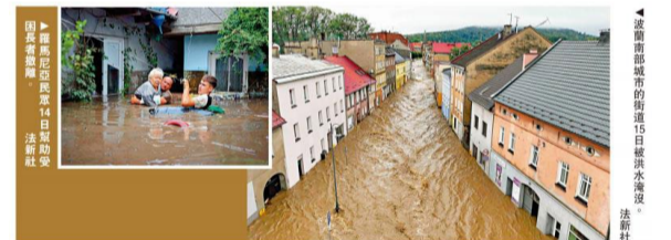
罗马尼亚民众14日帮助受困长者撤离。右图：波兰南部城市的街道15日被洪水淹没。

在捷克，警方15日通报有四人失踪。14日有1辆载着3人的汽车摔入利波瓦拉兹涅附近的史达里克河，目前仍在搜索中。另一人在东南部被洪水卷走后失踪。该国南部的一座水坝溃堤，洪水淹没了下游的城镇和村庄。