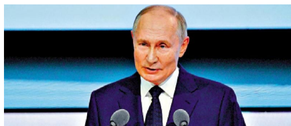
俄罗斯总统普京12日在圣彼得堡一个文化论坛上发表讲话。