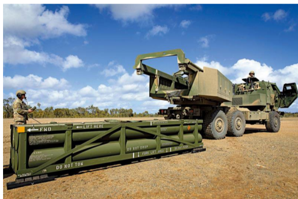
美国向乌克兰提供的远程导弹ATACMS。

9月4日，美国财政部以“干预美国选举”为由宣布制裁10名个人和2个实体，包括RT总编辑西蒙尼扬和副总编辑布罗德斯卡娅。