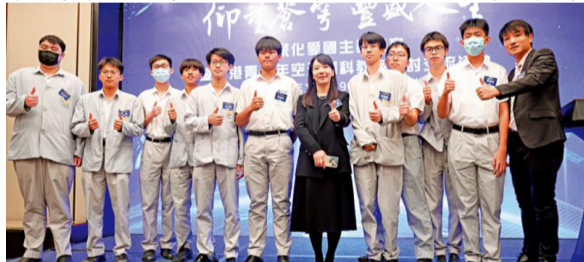
同学们聆听科学家的分享，加深对国家航天科技的认识，获益良多。

从早期的航天计划到现今的技术进步，“像是从当时的长征一号到现在的天舟，这都是非常伟大的事业。”他期望在完成DSE后，能够继续深造，更期待未来能去内地升学，探索更多航空领域的发展机会。