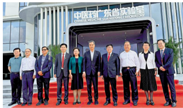
梁振英参观中医药广东省实验室。

克庆、国家中医药管理局国际合作司司长吴振斗等致辞，湖南省政协主席毛万春、江西省政协副主席谢茹、广东省政协副主席王学成等作为联席会议成员单位作出工作报告。13个省区市政协及中医药管理部门观察员出席会议。