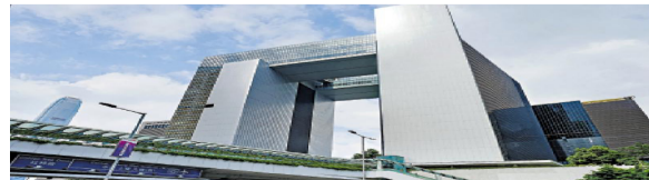
特区政府发言人表示，香港在“一国两制”下保持着深受信赖的法律制度，而法治更是一直得到社会的广泛认同和尊重。

发言人强调，香港的法律援助制度覆盖全面、稳健、经费充足，这亦对维护法治起着举足轻重的作用。除此之外，在基本法和香港人权法案条例的保障下，香港市民享有向法院提起诉讼及寻求司法补救的基本权利。