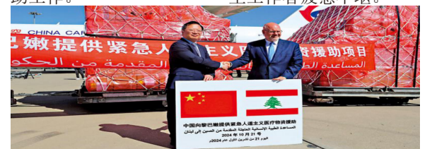
中国驻黎巴嫩大使钱敏坚（左）21日出席紧急人道主义医疗物资交接仪式。

量人员伤亡。应黎巴嫩政府请求，中国政府决定向黎巴嫩提供紧急人道主义医疗物资援助，以帮助黎方开展医疗救助工作。