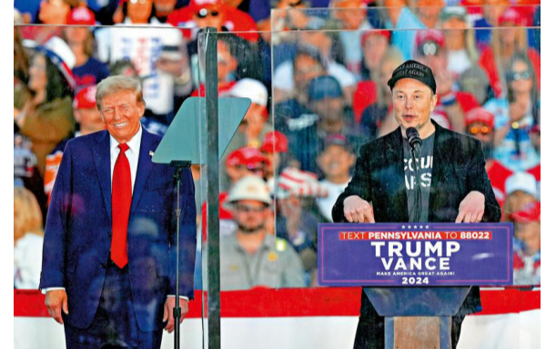
马斯克（右）重金助特朗普竞选。图为5日马斯克与特朗普在宾夕法尼亚州举行造势活动。