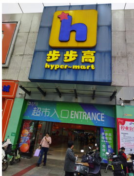
中国新报湖南讯（记者 陈中杰）

离农历春节还有两个多月，可是商超的竞争仿佛提前遭遇了“倒春寒”，近日，步步高位于长沙火车站商圈的朝阳店宣布将于12月9日正式停业，一同受影响的还有半年前租赁步步高近一半面积的衣城惠服装超市