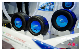
中国中化展示的民航轮胎产品。