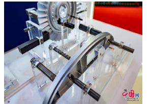
先进制造链展区内展示的应用于航空航天领域的加工刀具解决方案。