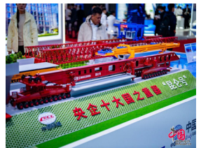
大国重器“昆仑号”千吨级运架一体机亮相链博会。中国网记者 郑亮摄