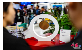
中国中车展示的用于新能源汽车的晶圆产品。