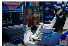
先进制造链展区展示的矿山远程驾驶系统。