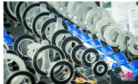
GE带来的实现100%国产化的替代“光栅”的“时栅”产品，主要用在数控机床，回转工作台，特种装备，航空航天等领域。

先进制造链展区的设立，不仅体现了链博会作为全球化平台的创新探索，更为现代化产业体系的建设提供了重要助力。在这一展区中，中外企业通过技术、资源和市场的互联互通，正共同书写全球制造业合作发展的新篇章。