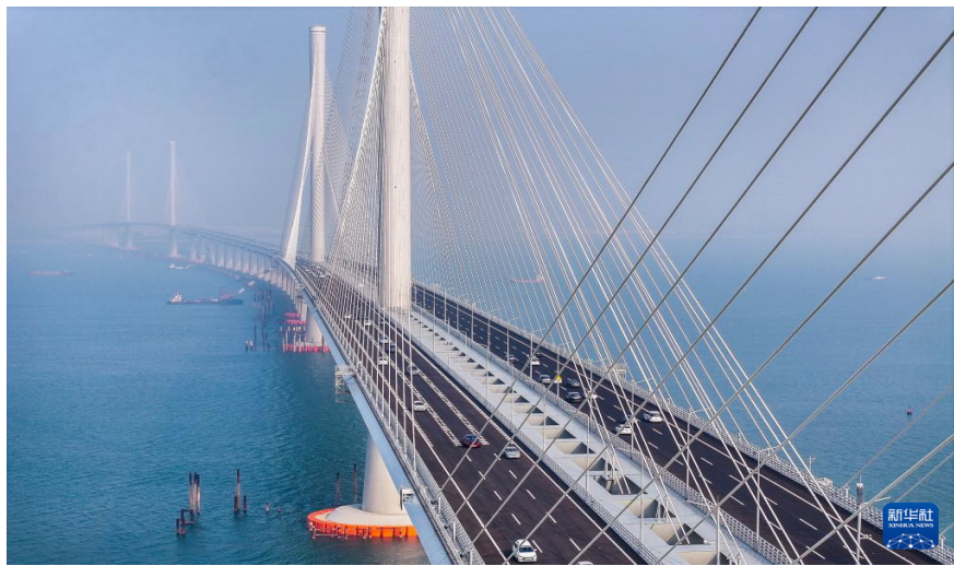
12月11日，黄茅海跨海通道正式通车后，车辆行驶在黄茅海大桥上（无人机照片）。