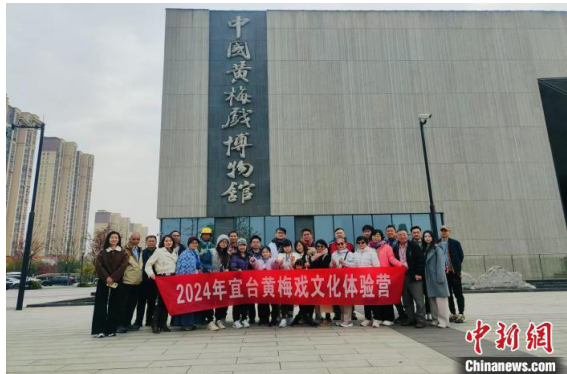
12月，台胞一行参观黄梅戏博物馆。

据悉，安庆先后五次组团赴台演出黄梅戏，场场爆满、好评如潮。从20世纪90年代起，安庆就持续举办中国黄梅戏艺术节及展演周，专设台企台胞台属专场。