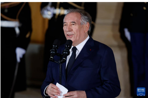
12月13日，在法国巴黎，弗朗索瓦·贝鲁出席权力交接仪式。