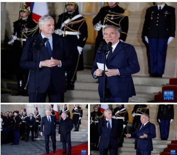
12月13日，在法国巴黎，巴尼耶（前左）与弗朗索瓦·贝鲁（前右）出席权力交接仪式。