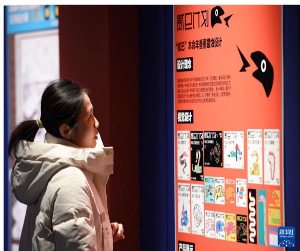
12月14日，观众在观看展览。