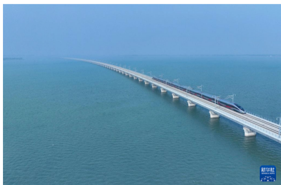
12月26日，列车驶过沪苏湖高铁元荡湖段（无人机照片）。

新华社上海12月26日电 题：沪苏湖高铁通车运营 “轨道上的长三角”再添新动脉 新华社记者樊曦、贾远琨、魏一骏