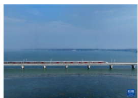
12月26日，列车驶过沪苏湖高铁元荡湖段（无人机照片）。

路网与城际功能并重让这条线路与城市深度融合。沪苏湖高铁位于长三角核心区域内，沿线城镇密集，多为经济重镇、国家级和省级历史文化名镇，商务、旅游、务工等城际客流需求旺盛，城际功能显著。