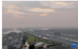
12月26日，列车清晨驶过沪苏湖高铁苏州段（无人机照片）。

“沪苏湖高铁是长三角一体化基础设施互联互通的重大项目，也是长三角G60科创走廊互融互促的交通大动脉。”上海交通大学副