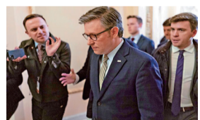
美国国会共和党籍众议院议长约翰逊。

【大公报讯】 综合美联社、路透社报道：美国财政部长耶伦在 27 日表示，美国最快将在明年 1 月 14 日触及债务上限，呼吁国会尽快采取“非常措施”。