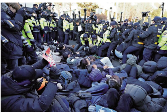
尹锡悦支持者 2 日躺在总统官邸门前，试图阻拦调查人员，最终被警方拖走。

韩国紧急戒严风波持续发酵，高级公职人员犯罪调查处（简称公调处）最快 3 日对被停职的总统尹锡悦予以逮捕。2 日，警方在总统官邸门前驱散试图阻拦调查人员的尹锡悦支持者，现场一片混乱。公调处警告说，任何人若试图阻止当局逮捕尹锡悦，都可能因妨碍公务被起诉。尹锡悦的律师就逮捕令向法院提出异议申请。尹锡悦则致信支持者，声称要“战斗到底”。在野党批评尹锡悦煽动支持者，试图策划叛乱。