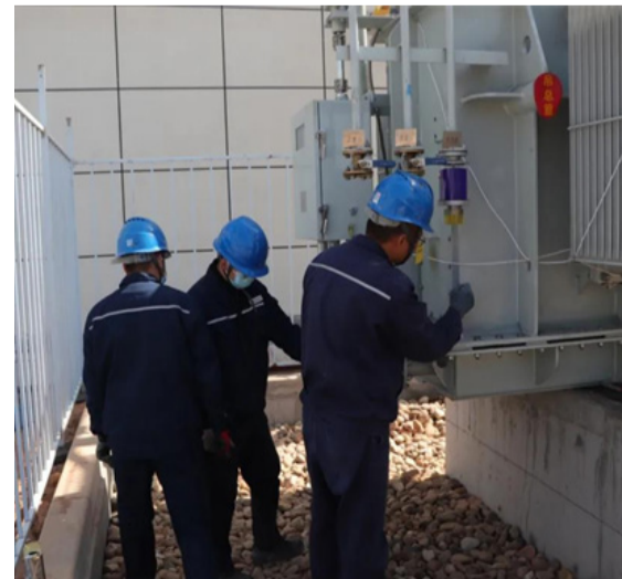
小陶抽蓄变电站设备调试中