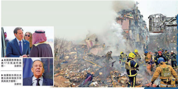
▲美国国务卿鲁比奥17日抵达利雅得。▲俄罗斯外长拉夫罗夫及随行官员在沙特首都利雅得。▲乌克兰总统泽连斯基和德国总理朔尔茨(右)上周在慕尼黑会晤。

左上图：美国国务卿鲁比奥17日抵达利雅得。法新社；左下图：俄罗斯外长拉夫罗夫将率领俄方官员与美方会晤。法新社；右上图：乌克兰波尔塔瓦地区遭俄导弹袭击，救援人员在废墟中搜寻伤者。左下图：乌克兰总统泽连斯基和德国总理朔尔茨(右)上周在慕尼黑会晤。法新社