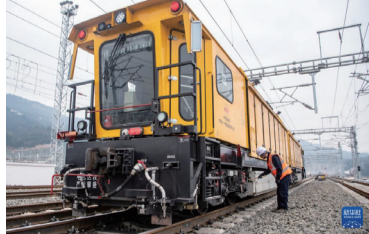
2月18日，在重庆东站建设施工现场，中铁十一局的铁路工人正在查看钢轨打磨车的运行状态。