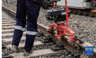
2月18日，在重庆东站建设施工现场，铁路工人正在对线路进行精调作业。