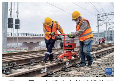
2月18日，在重庆东站建设施工现场，铁路工人正在对线路进行精调作业。