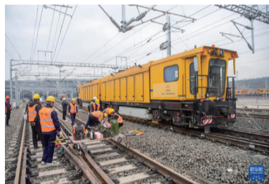
2月18日，在重庆东站建设施工现场，铁路工人正在对线路进行精调作业。