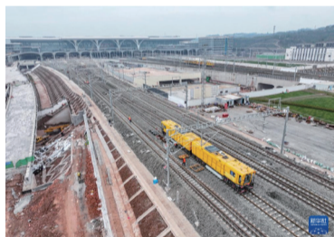
这是2月18日拍摄的重庆东站建设施工现场线路精调作业现场（无人机照片）。