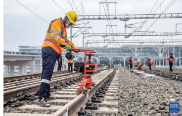
2月18日，在重庆东站建设施工现场，铁路工人正在对线路进行精调作业。