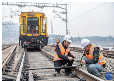
2月18日，在重庆东站建设施工现场，铁路工人正在对线路进行精调作业。