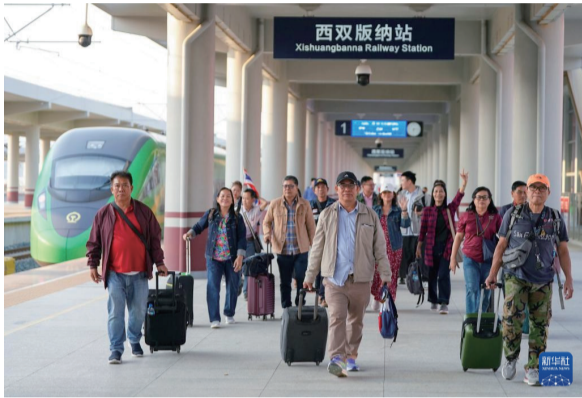
2月18日，来自泰国和老挝的游客抵达中老铁路西双版纳站。