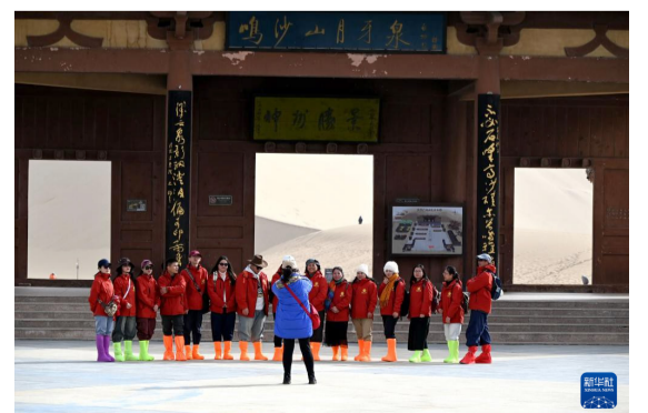
3月2日，游客在甘肃省敦煌市鸣沙山月牙泉景区拍照留念。