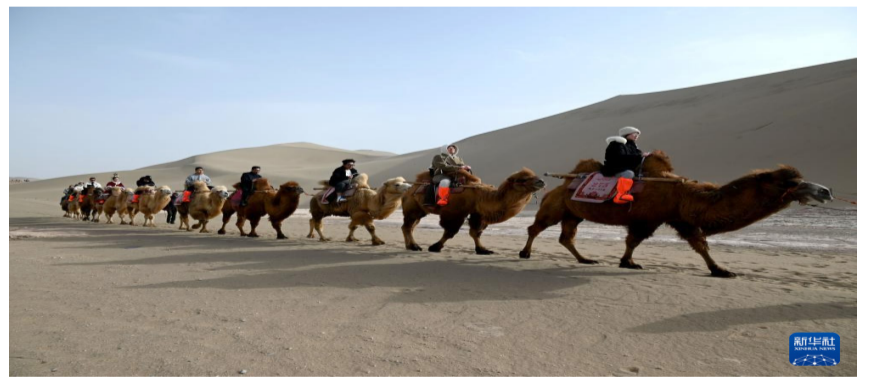
3月2日，游客在甘肃省敦煌市鸣沙山月牙泉景区游览。

在冬季旅游优惠活动结束后，甘肃省敦煌市延续部分景区门票优惠政策，从3月1日至3月31日，鸣沙山月牙泉、玉门关遗址、敦煌雅丹世界地质公园三大市属景区推出门票半价优惠政策，吸引游客来这里欣赏大漠风光、体验丝路风情。