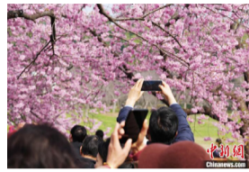
3月6日，武汉东湖樱园初绽的早樱吸引众多游客前往“打卡”。

今年该市各赏花产品全面升级。例如，东湖樱花园推出晨曦赏樱、空中赏樱、夜间赏樱、梅樱同赏等特色赏花项目；两江四岸长江灯光秀准备了樱花特辑；世界田联金标赛事——武汉马拉松将于樱花季期间举办，跑者将在樱花树下体验“最美赛道”；武汉各大商圈、景点、重点道路已布置了多种实景樱花树，全城皆可邂逅浪漫樱姿。